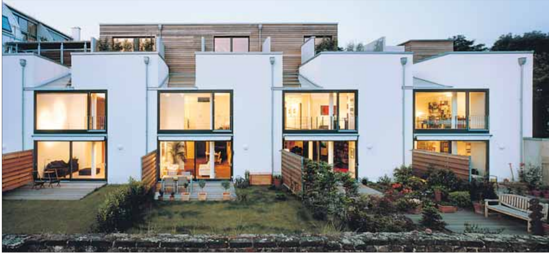
Auf den ersten Blick erkennen Betrachter sicher nicht, dass es sich bei diesen zweigeschossigen Eigentumswohnungen in Köln-Nippes um einen ehemaligen Bunker handelt...

Beilagenredaktion Telefon 089/2183-305, Fax -776 sz-beilagen@sueddeutsche.de